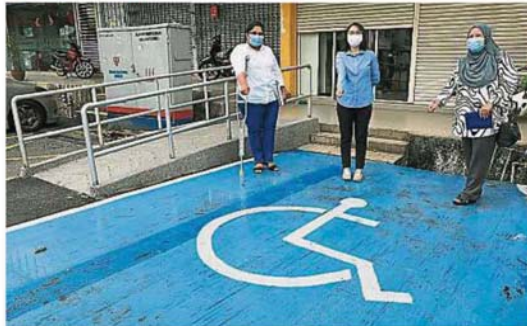
八打靈再也市政府至今已在轄內多個地區設立了共251個殘障人士專用泊車位。(檔案照)

他解釋，有關接駁車只負責接載殘障人士前往馬大醫藥中心、阿松大醫院(Assunta)、敦胡先翁國家眼科醫院、市政府規定的診所或醫院(Panel)、福利局(JKM)、國民登記局(JPN)和馬大社會保險機構(PERKESO)，且必須提前致電：03-7956 0203預約，並以往往鄰近地點為優先考慮。