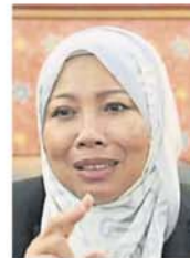
诺莱妮：月子中心允许在住宅区营业。

辖内大型超市注册有 15 家、超市/迷你超市/便利店/连锁店 209 家、餐馆/咖啡厅/吃店 69 间、药房/健康用品/护理 48 间，以及其他 (如饰品店/衣服店等) 56 间，共 397 家。