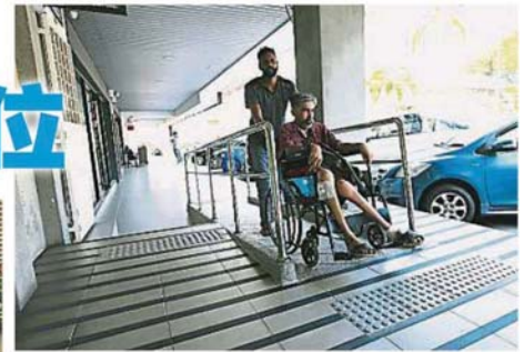
八打靈再也市政府早前在靈市52區商業區增設多個斜坡道，方便殘障人士出入。(檔案照)

“PJ City Bus的手機應用程式主要方便乘客獲取更有效率服務，且也適用於所有乘客，包括殘障人士。”