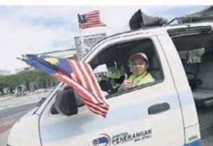
▲独立日流动播报车将于全国153个县举办一系列爱国活动，传达爱国信息。

旦有大马人取得成功，就会见到有人悬挂国旗。身为大马人，每次见到有大马人在各领域取得成功，必定会感到骄傲。” 慕尤丁致词后，紧跟著在大马武装部队（ATM）乐团新闻局合唱团的演奏下奏起国歌，由代表前线团队的6名代表主持升旗仪式，分别是武装部队、大马皇家警察、移民局、志愿队、卫生部及新闻局。接著，再演奏今年国庆日的主题曲。 出席推介礼包括高级政务部长（教育部）莫哈末拉兹博士、高级政务部长（国防部）拿督斯里依斯迈沙比里、高级政务部长（国际贸易及工业部）拿督斯里阿兹敏阿里、通讯及多媒体部长拿督赛夫丁阿都拉、副部长拿督查喜迪及通讯部秘书拿督苏丽雅妮等。