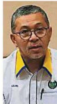
阿兹兰:泰国籍非法入境者确诊。

玻州于3月12日出现首名确诊冠病的病患,至4月14日为止,共18人确诊,2人不幸病逝,16人已痊愈。