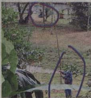
■有民众拍到有人在公园内疑似为施工进行测量工作。