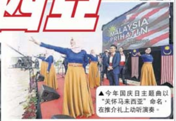
▲今年国庆日主题曲以“关怀马来西亚”命名，在推介礼上动听演奏。