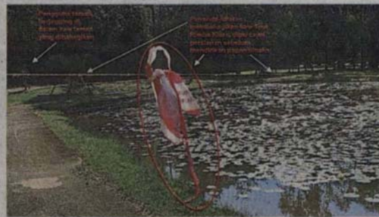
■加拉森林公园多处包括跑步道、池塘、草地等被人发现插上木杆，怀疑将兴建围板及施工。(《Selamatkan Taman Rimba Kiara》脸书照片)