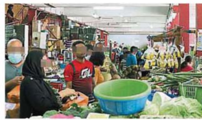
八打靈再也市政府積極打擊由“勞板”經營的非法商業活動。(檔案照)

“無論如何，八打靈縣的3個地方政府中，靈市政府的骨痛熱症病例(2900宗)是最低的；梳邦再也市議會轄下範圍一共累計了4656宗，沙亞南市政府則有4082宗。”