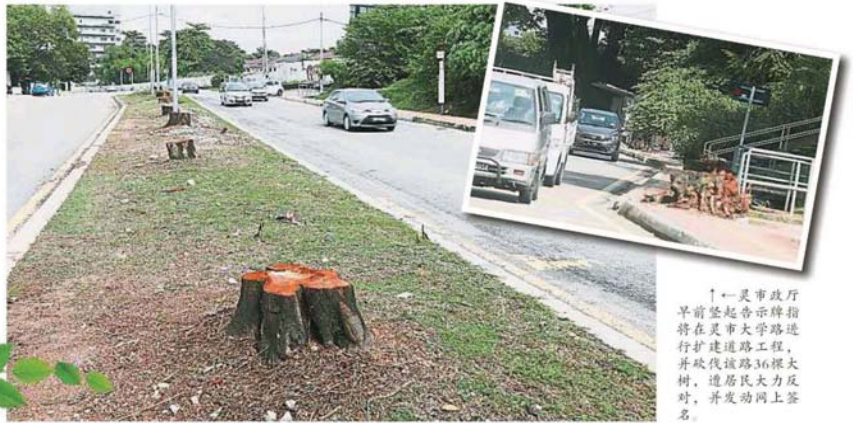
↑一靈市政府早前豎起告示牌指將在靈市大學路進行擴建道路工程，並砍伐該路36棵大樹，遭居民大力反對，並發動網上簽名。

“翠綠的樹木讓我們居住在靈市17區的居民在回家的道路上，顯得特別寧靜及解壓，但遺憾的是市政府在做出砍樹的決定前，並沒有征求居民的同意。”