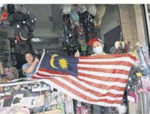
▲在遵守标准作业程序下，独立日流动播报车团队为商家送上国旗，鼓励悬挂“辉煌条纹”。