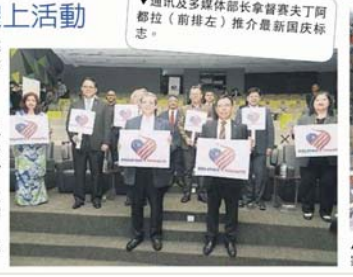
▼通讯及多媒体部长拿督赛夫丁阿都拉（前排左）推介最新国庆标志。

为了进一步推动爱国精神，大马通讯及多媒体部也善用科技，在网络上一系列爱国活动，让全国人民可以一同参与。 其中的活动包括“Smile爱国之星比赛”、“国家演讲比赛”、“全国讲故事比赛”、“爱国月绘画上色比赛”、“爱国短篇小说比赛”、“爱国诗歌比赛”及KL1KMerdeka摄影比赛等。有兴趣报名的民众可浏览www.penerangan.gov.my/jcpen2/了解更多。 另外，大马通讯及多媒体部也鼓励在使用社交媒体上传与国庆日相关的视频或图片时，可以使用标记#MalaysiaPrihatin、#MerdekaMoment、#MalaysiakuMerdeka及#KtbarJalurGemiLang，分享爱国时刻。