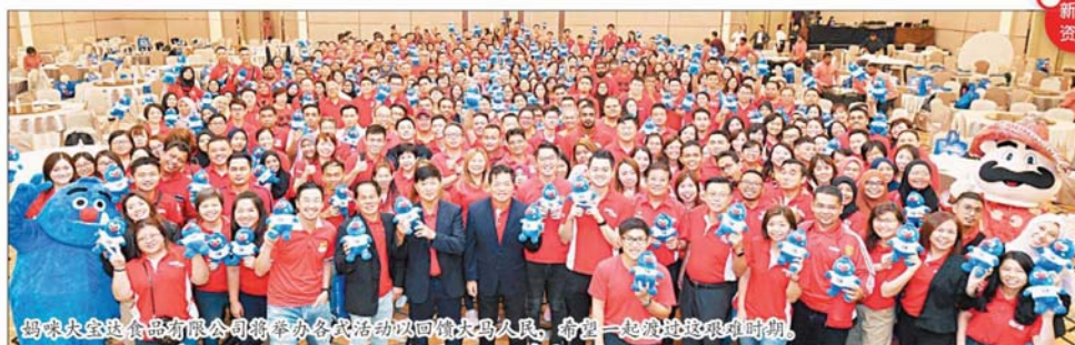
妈咪大宝达食品有限公司将举办各式活动来回馈大马人民, 希望一起渡过这艰难时期。