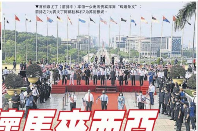
▼首相慕尤丁（前排中）率领一众出席贵宾挥舞“辉煌条纹”；前排左2为赛夫丁阿都拉和右2为苏丽雅妮。

“关”怀马来西亚”主题结合了“马来西亚”及“关怀”字眼，描述大马人民在对抗疫情做出的努力，以及政府所采取各种举措，涵盖经济和福利方面的问题，协助人民渡过难关。 标志中，7条构成心形的红白相间条纹，代表著使用真诚和诚恳的心，面对所有障碍的勇气；深蓝色则是代表各族团结生活在和平及和谐的环境中。 另外，大花柱代表国家向成功迈进，其中5个红点也象征国家原则50周年纪念；新月标志则象征伊斯兰教为联邦宗教；14芒星则象征13个州属与联邦政府。