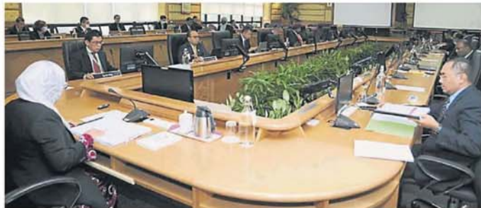
相隔多月，梳邦再也市政厅恢复举办常月会议，但都有保持社交距离。

“他们要置放十字架，或是佛教、兴都教等的标志，只要不是太大的设计，一般都获准；也不反对基督教办主日学、佛教在店内开会或是义诊，因为这都不影响他人。”